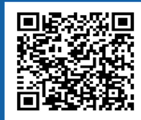
สแกน QR Code เพื่อแอด LINE

เป็นโรงพยาบาลทั่วไป ระดับ S ขนาด 445 เตียง มีเนื้อที่ทั้งหมด 37 ไร่ 10 ตารางวา โดยมีเนื้อที่ค่อนข้างเป็นรูปสี่เหลี่ยมผืนผ้า