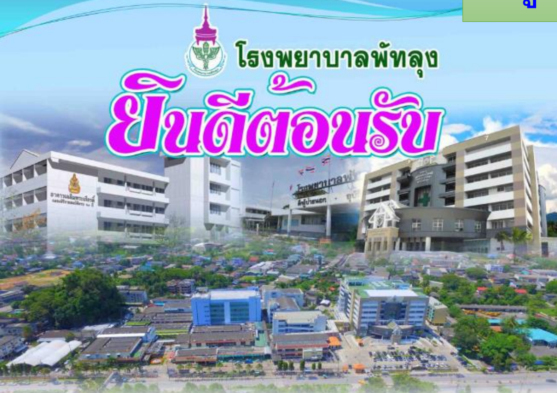
สถานที่ตั้ง

โรงพยาบาลพัทลุง ตั้งอยู่เลขที่ 421 ถนนรามเสวร์ ตำบลคูหาสวรรค์ อำเภอเมือง จังหวัดพัทลุง รหัสไปรษณีย์ 93000