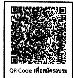
QR-Code เพื่อสมัครอบรม

หมายเหตุ กรณีผู้เข้ารับการฝึกอบรมจะดำเนินการชำระเงินค่าที่พักและค่าเดินทางล่วงหน้า ต้องได้รับการยืนยันดำเนินการจัดฝึกอบรมจากเจ้าหน้าที่แล้วเท่านั้น หากไม่ได้รับการยืนยันจากเจ้าหน้าที่ถือว่าไม่มีการดำเนินการจัดฝึกอบรมในหลักสูตรนั้น ผู้เข้ารับการฝึกอบรมจะไม่สามารถขอรับเงินค่าที่พักและค่าเดินทางคืนจากทางมหาวิทยาลัยได้