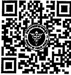
QR Code เข้าร่วมประชุมฯ

โครงการประชุมเชิงปฏิบัติการส่งเสริมหน่วยงานในสังกัดสำนักงานปลัดกระทรวงสาธารณสุข ส่งเสริมรับรางวัลเลิศรัฐ ประจำปีงบประมาณ พ.ศ. ๒๕๖๗ ผ่านระบบออนไลน์ ในวันที่ ๑๐ - ๑๑ มกราคม ๒๕๖๗ เวลา ๐๘.๓๐ - ๑๖.๓๐ น.